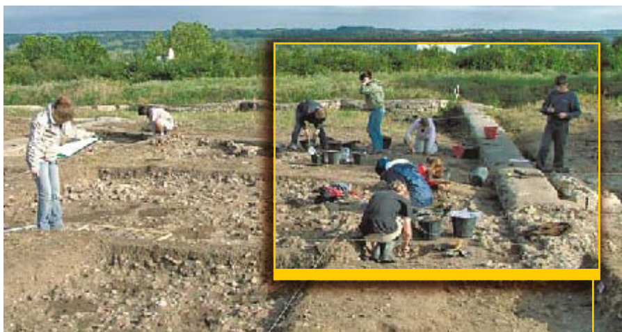
Une trentaine de bénévoles seront accueillis cette année sur le site archéologique d'Amboise.

L'autorisation pour les fouilles m'a été donnée en 2006, pour une durée de 3 ans. Depuis janvier 2007, l'oppidum d'Amboise fait partie des sites majeurs de région Centre. De ce fait, le projet de recherche bénéficie d'un financement plus élevé qui permettra la mise en oeuvre de techniques modernes de fouilles comme la géophysique (prospection magnétique des sols). Quant à la mairie d'Amboise, elle m'aide sur le plan logistique avec le prêt d'une pelle mécanique par exemple. Je soutiendrai ma thèse à la fin de l'année 2008, mais j'espère continuer mes recherches à Amboise car le temple représente environ 900 m 2 de richesses archéologiques à découvrir.