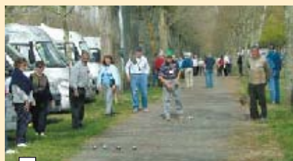
Tournoi de pétanque improvisé dans les allées du camping

volley-ball...), un parcours de santé, un circuit bi-cross. Près de l'entrée, le bar-