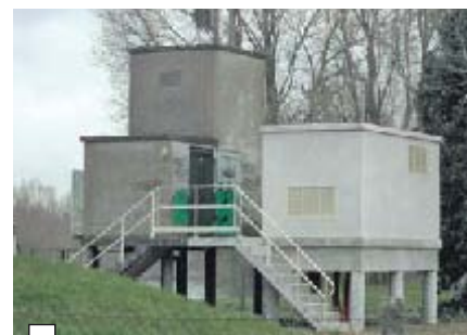
Le poste privé sera remplacé par un nouveau transformateur.

Dans le cadre du chantier d'enfouissement de réseaux de 20 000 volts en traversée de l'Île d'Or, une démonstration a eu lieu le 21 mars, en présence de l'entreprise