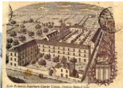
Les anciens du collège ont fait apposer une plaque commémorant le lieu de l'ancien collège Charles Guinot.