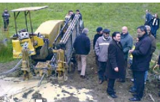
Séance de forage pour l'enfouissement des réseaux électriques de 20 000 volts dans l'Île d'Or.

Débutée fin 2006, la première tranche de travaux a consisté à enfouir de nouveaux câbles en partant du quai des Violettes vers la Z.I. Boitardière. La deuxième partie de l'opération, commencée en début d'année, est la traversée de la Loire par un forage dirigé. Coût de l'opération :