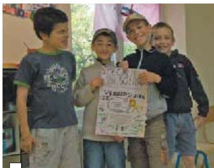
Grâce à leur spectacle solidaire, les enfants ont récolté de nombreux dons.

C'est à la MJC, que le vendredi 27 avril, les enfants de l'Accueil de Loisirs d'Amboise ont organisé un spectacle solidaire au profit de jeunes de Brazzaville