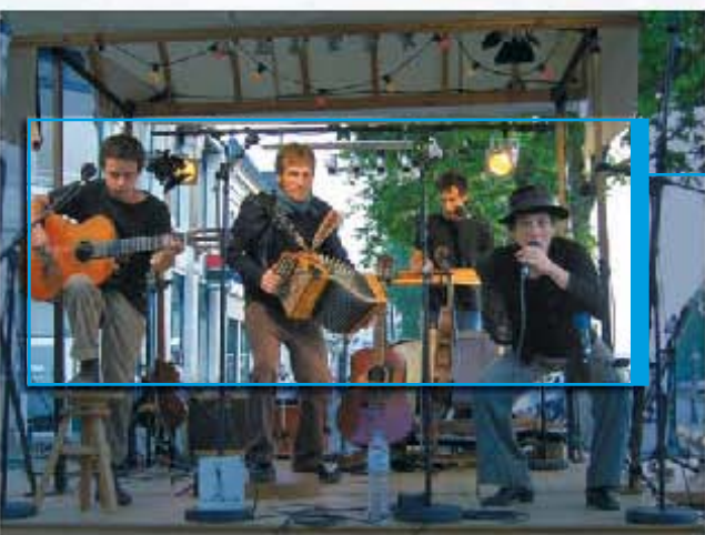
Ambiance guinguette très conviviale lors du concert du groupe Lombric au bar restaurant L'Entrepôte.