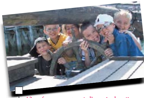
43 enfants sont partis l'année dernière pour des vacances pleines de sourires au centre nautique de Tréboul.

Autre option proposée aux jeunes vacanciers : les séjours de vacances qui, sur une durée de deux semaines, permettent à des enfants de 7 à 13 ans de profiter des délices de la mer ou de la montagne. Le premier séjour, organisé du 14 au 27 juillet, se déroulera au centre nautique de