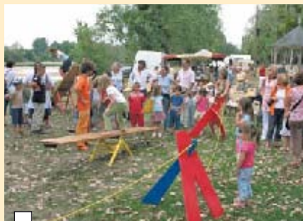
Edition 2006 de la manifestation Tous autour du kiosque

compagnie Dine et Déon et une aire de pique-nique aménagée avec des jeux pour enfants pour l'après-midi et la soirée.