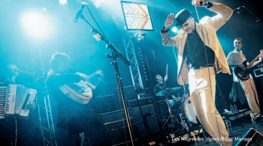
Les Négresses Vertes