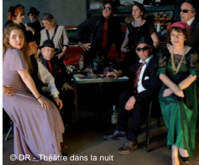
Théâtre dans la nuit