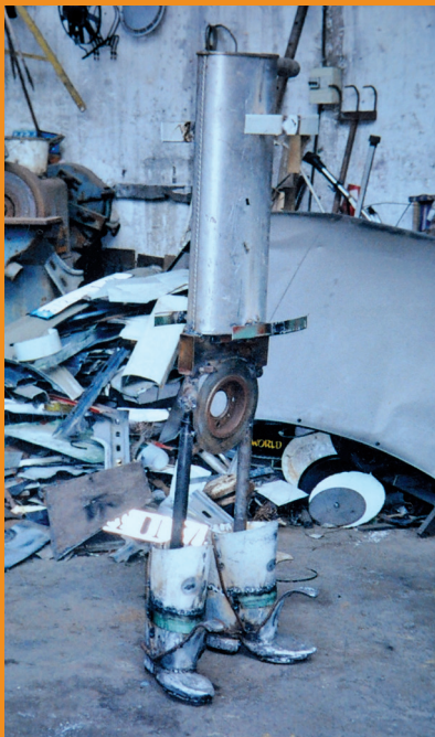
Création du personnage d'Abd el-Kader au garage Dumagny.