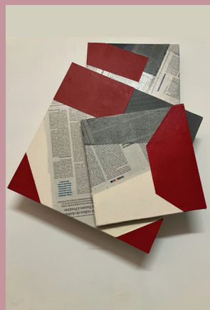
Luciano FIGUEIREDO Relief, 2025

CREDITS : ACRYLIQUE SUR TOILE - 2012 BL. FIGUEIREDO - « LE DERNIER CRÉPUSCULE » - 2022 BH. DELÉPINE