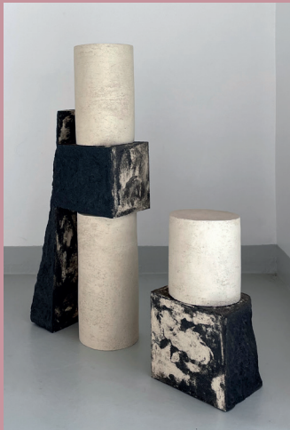
Hélène DELÉPINE Architecture sédimentaire #2, 2019