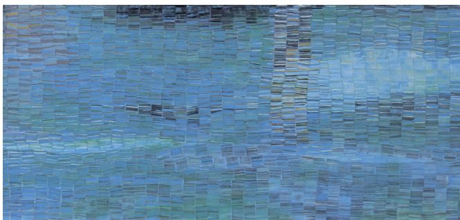
Max DUPUY, La Loire en caban de pêcheur © Max DUPUY.

Les œuvres invitent à observer le fleuve et ses alentours comme des paysages changeants et poétiques, où la lumière et l'eau dessinent une palette de couleurs et de formes exponentielles.