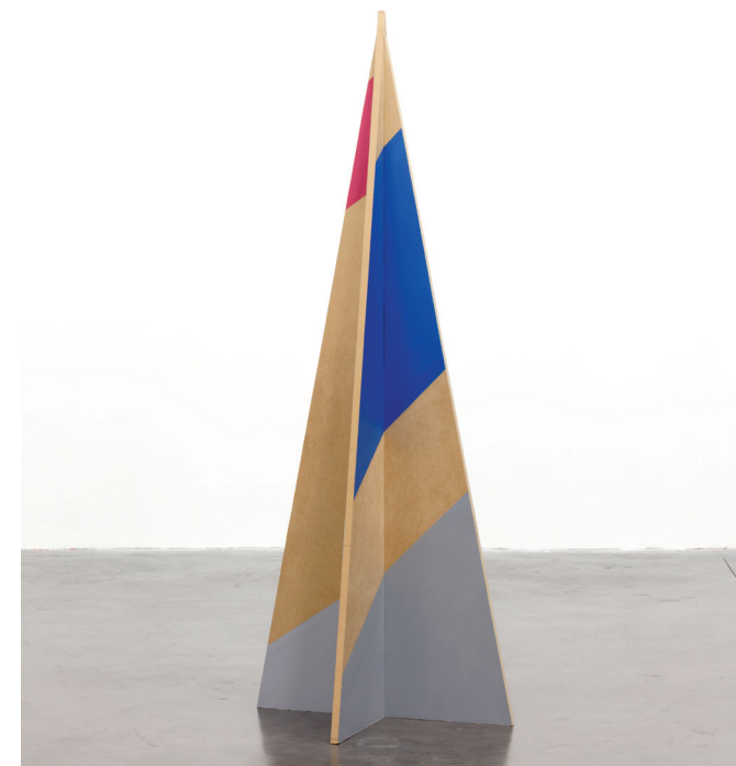
Roxane BORUJERDI, Sapin, série Buissons et pointes.

Sur réservation uniquement / Gratuit / À destination des scolaires, périscolaires, associations et autres publics.