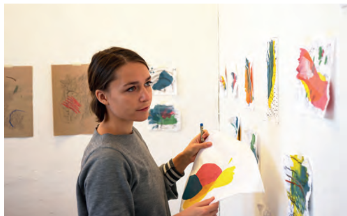
Justine GHINTER © D.R.

En laissant libre cours à ses préoccupations, c'est l'occasion pour l'artiste de mettre en scène des images dans lesquelles, le visiteur peut se perdre ou se laisser surprendre. Cette proposition singulière dupe les systèmes d'interprétation, exacerbe la curiosité et détourne la réalité pour ne laisser au final qu'une suggestion.