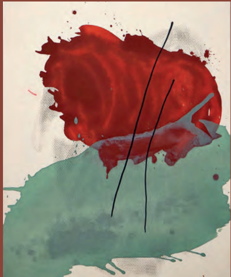
Peinture-impression © Justine GHINTER