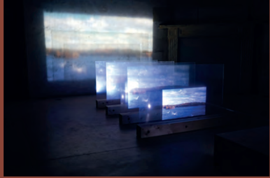
La traversée

LE GARAGE CENTRE D'ART 1 RUE DU GÉNÉRAL FOY 37400 AMBOISE TÉL 02.47.79.06.81 WWW.VILLE-AMBOISE.FR/LEGARAGE MER > VEN 14H30-18H30 SAM > DIM 11H-13H/15H-19H ENTRÉE LIBRE