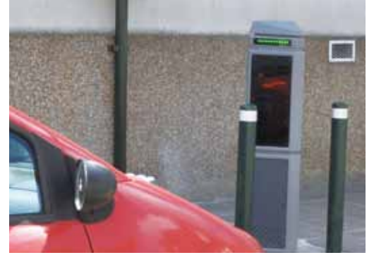
> La Borne rue de Montebello

> Le principe : Cette borne donne accès à un stationnement gratuit de 20 minutes pour les deux emplacements concernés. L'idéal pour une course rapide ! A deux pas des boulangeries, de la Poste ou des services de banque, le choix de cet emplacement n'est donc pas un hasard. Proposée à l'association des commerçants, cette solution a été accueillie comme une réponse à la rotation des véhicules en centre-ville. L'expérience va permettre à la municipalité d'obtenir des statistiques sur l'utilisation de ces emplacements. Ces chiffres, additionnés aux avis des usagers et