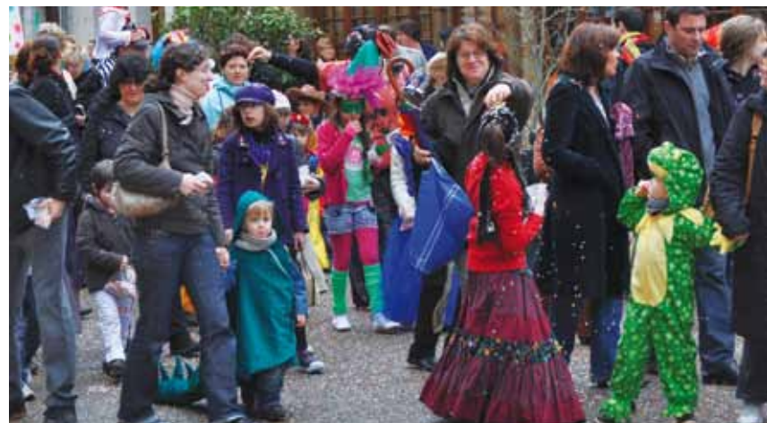
> Carnaval des écoles : une joyeuse troupe colorée

Malgré la pluie les petits Amboisiens étaient bien là ! Indiens, princesses, monstres, sorcières... ont sorti leurs plus beaux costumes et ont défilé dans les rues d'Amboise au rythme des 3 batucadas dont la toute nouvelle formation de l'école de musique d'Amboise. Rires, farces et jeux n'ont pas manqué, à la plus grande joie des parents qui accompagnaient leurs enfants. Le défilé s'est terminé place Michel Debré avec un goûter offert par la Ville.