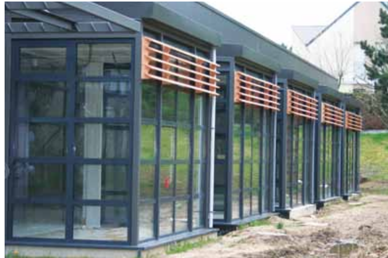
> Les kiosques ont été équipés de stores vénitiens

La Ville d'Amboise étudie actuellement les treize candida-