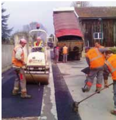
> Le coût total des travaux s'élève à 60 000 €

Le coût total des travaux s'élève à 60 000 €, dont 50 % sont financés par la Ville d'Amboise.