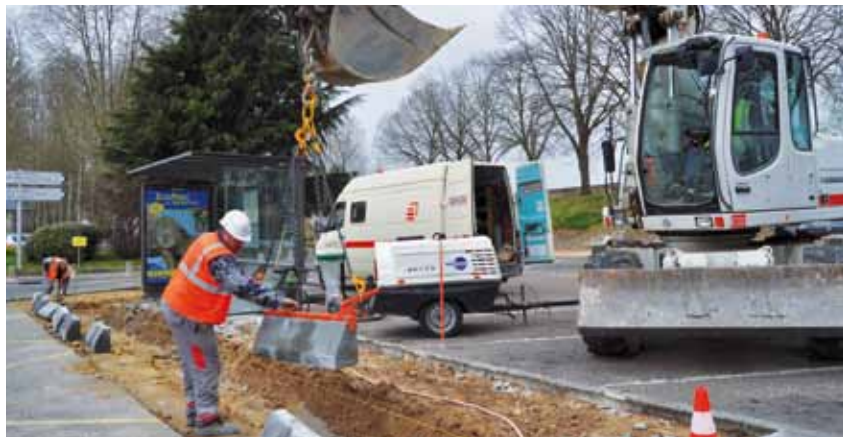
> Travaux d'aménagement des arrêts de bus, adaptés aux personnes à mobilité réduite

Une plaquette avec les horaires de passage du bus est disponible en mairie, à la gare, l'office de tourisme, au pôle jeunesse et autres structures d'accueil. Elle est également téléchargeable sur le site Internet de la Ville ( www.ville-amboise.fr ).