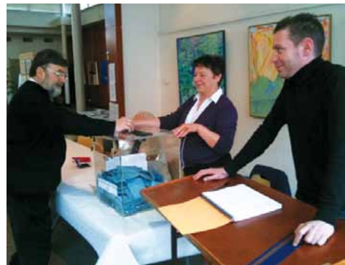
> Bureau de vote de la salle des fêtes Francis Poulenc

Dimanche 21 mars, les électeurs étaient appelés à voter pour élire les représentants de leur région. François Bonneau a ainsi été réélu Président du Conseil régional du Centre. A Amboise, sa liste a recueilli 50,22 % des suffrages.