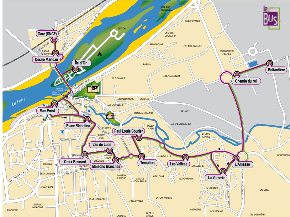
> Le bus s'arrêtera au maximum à 450 mètres du domicile de 100 % des demandeurs d'emplois et des allocataires du RMI des deux quartiers prioritaires

Pendant un an, les services de la Ville ont mené différentes études auprès des Amboisiens, des entreprises et des acteurs locaux (Mission Locale, CCAS, Pôle Emploi...) pour identifier les besoins de la population, connaître ses attentes en termes d'horaires et de trajet. Ces études ont permis de définir le tracé le mieux approprié pour desservir un maximum de personnes aux endroits les plus fréquentés. Au total, la ligne comprend 15 arrêts, de la zone industrielle de la Boitardière à la gare SNCF, en passant par la Verrerie, le quartier Malétrenne-Plaisance (Vau de Lucé et Croix Besnard), le centre-ville et l'Île d'Or. Ce trajet de 9 km, soit 24 minutes, rapproche les habitants des acteurs de l'emploi. Cette nouvelle ligne est calée sur les horaires de train, permettant à ceux qui travaillent à Tours, Blois ou Orléans, de bénéficier des transports en commun. Quant à ceux qui arrivent des communes voisines, ils pourront rejoindre plus facilement leur lieu de travail.