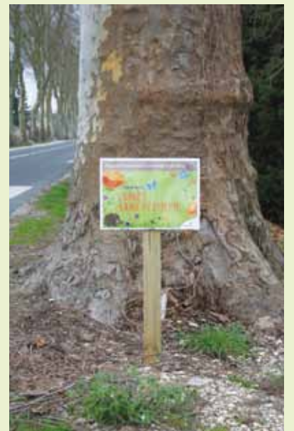
> Le premier platane avenue de Tours

Ce changement de pratique ne signifie pas pour autant un abandon : le fauchage régulier sera maintenu et une vigilance particulière sera portée à l'observation des résultats. L'évaluation de ces nouvelles pratiques permettra de décider du prolongement sur un secteur plus étendu.