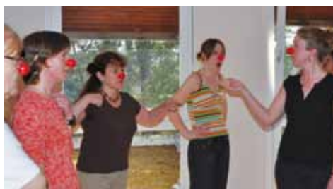
> Stage de clown à l'hôpital d'Amboise

La même semaine, des stages de clown se sont déroulés à l'hôpital d'Amboise et à l'Accueil de Loisirs. Objectif : libérer le clown qui est en cha-