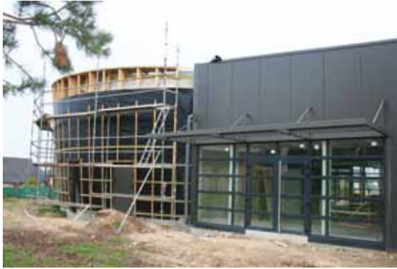
> Vue de l'auditorium avant l'habillage bois