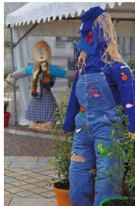
> Les enfants ont participé à leur façon à la manifestation : en confectionnant des épouvantails pour créer un cheminement dans la ville (enfants de l'ALSH), en exposant des sculptures réalisées à partir d'objets de récupération (enfants des écoles Anne de Bretagne et Jules Ferry) ou en fabriquant des mobiles et des radeaux à partir de matériaux naturels, pendant les ateliers proposés au jeune public.