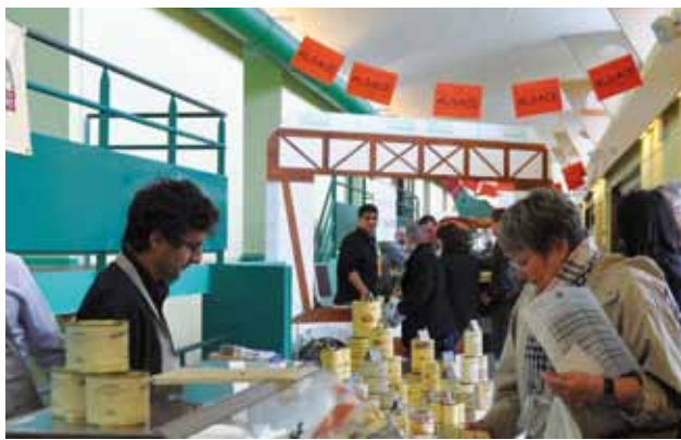
> Les Vinycées du lycée agricole d'Amboise, une réussite !

qui dépend totalement de l'implication des organisateurs, tous bénévoles : « Les Vinycées font partie intégrante de la vie du lycée. L'organisation de ces journées repose sur la motivation du personnel de l'établissement, les enseignants, les agents, le personnel d'exploitation. Nous sommes 45 à nous répartir les tâches : choix des vins, aménagement des stands, communication, accueil, restauration, visites guidées... Chacun apporte ses idées et ses compétences, sans notion de hiérarchie. Les décisions sont collégiales et tout se prépare en dehors du cadre de travail ».