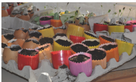
> A la rentrée, une animatrice développement durable interviendra notamment sur les groupes primaires.

Même si certaines améliorations sont à apporter, les parents ont manifesté leur satisfaction quant à cette initiative. Pour les enfants, ils ont leur préférence et apprécient plus particulièrement les activités portant sur les arts plastiques, la création de jeux, la réalisation en 3D et les cours de cuisine.