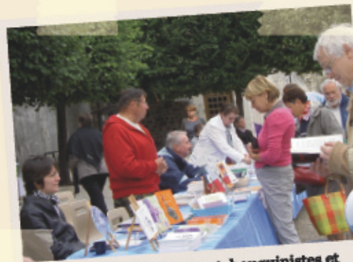
Malgré le ciel menaçant, bouquinistes et auteurs se sont installés place Michel Debré le dimanche 17 juillet pour la Journées du livre . Les passants ont pu échanger avec les écrivains, découvrir des artistes méconnus et faire dédicacer leur livre.