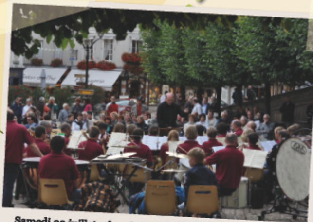
Samedi 23 juillet, place Michel Debré, Amboisiens et touristes ont pu apprécier un début de soirée sympathique animé par l' orchestre de l'Harmonie Royale de Avelgem (Belgique). Les airs se sont enchaînés, variés et rythmés pour le plus grand plaisir de tous.