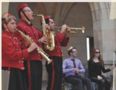
Burlesque, décalé à souhait, l'opéra " Un Roi Arthur " a séduit le public. Avec un humour irrésistible, les chanteurs d'opéra accompagnés de la fanfare des Grooms ont interprété, à leur façon, l'œuvre de Henry Purcell, dans le parc du château. Surprenant !