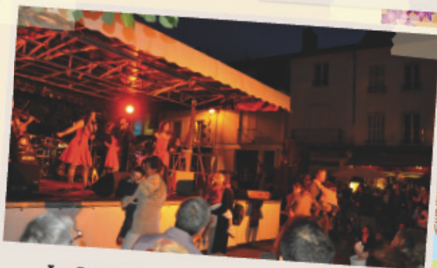
Les Sceurs Moustache ont su capter le public, le transportant dans leur univers, à mi-parcours entre Tim Burton et les triplettes de Belleville. Enchantés, les spectateurs se sont laissés bercer par ces mélodies oniriques et n'ont pas hésité à danser.