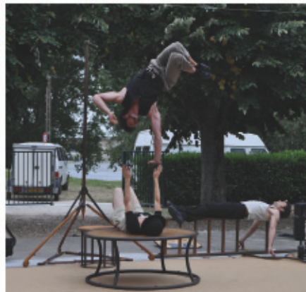
> Toute en harmonie, la compagnie 3 fois rien a émerveillé les visiteurs de Rétro Folies.

Côté mécanique, l'association des voitures anciennes de Château-Renault est venue proposer