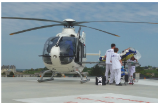
> L'hélistation permet d'intervenir dans les cas d'urgence

Le centre de prélèvements externes (prises de sang et autres prélèvements) est ouvert du lundi au vendredi de 7h30 à 17h. Les prélèvements se font sur rendez-vous, au 02 47 23 31 52 (8h30-17h).