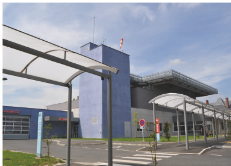
> Le nouveau bâtiment sera inauguré le 16 septembre 2011

Une partie d'entre eux exercent à la fois à Am-