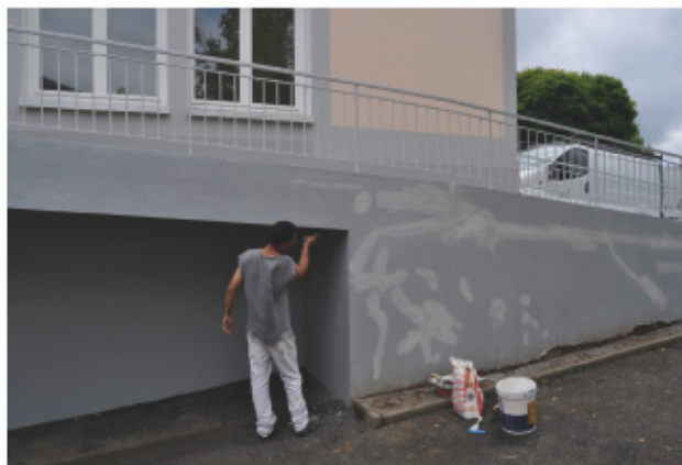
> Intérieurs et extérieurs de l'école maternelle George Sand dans le quartier de la Verrière ont été embellis pendant l'été.

Depuis 3 ans, l'école George Sand est au cœur d'un programme de réfection, prévu par la municipalité, visant à améliorer l'isolation des bâtiments et à réduire ainsi les consommations d'énergie. Cette année c'est la dernière tranche des travaux qui a été réalisée. Depuis le mois de juin, les menuisiers ont fabriqué des portes et fenêtres isolantes en double vitrage qui ont été installées dans les sanitaires, couloirs et vestiaires de l'école. De la laine de verre a été placée au dessus des faux plafonds dans les lieux de circulation et les sanitaires, et certains murs ont bénéficié de plaques de plâtre pour renforcer l'isolation. Les électriciens et les peintres ont apporté la dernière touche aux travaux d'intérieur. Quant aux extérieurs, la rampe d'accès à l'école a été entièrement nettoyée et repeinte ainsi que la façade côté cour.