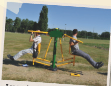
Les services de la Ville ont installé six body boomer sur l'Île d'Or. Ces appareils de gymnastique douce permettent aux visiteurs, sportifs ou non, de faire quelques exercices physiques, de façon ludique.