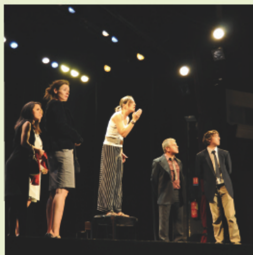
> Les cours de théâtre donnent lieu à un festival en fin d'année

Dynamique et optimiste, elle sait motiver les équipes qui l'entourent et saura sans aucun doute encourager les jeunes Amboisiens à s'impliquer dans la vie de leur cité.