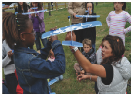
> Après la conception, les dernières finitions sur les planeurs et conseils pour les faire voler le plus loin.

Pour conclure la journée, un spectacle de cirque et d'acrobatie dans l'enceinte du canoë-kayak a émerveillé petits et grands. Les trois acrobates ont fait frissonner plus d'un spectateur par leurs pirouettes audacieuses réalisées avec légèreté, poésie et humour.