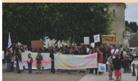
> Forte mobilisation des parents, élèves, instituteurs et des élus lors de la manifestation du samedi 7 mai à Amboise.