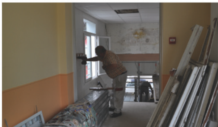
> Isolations des murs et plafonds des écoles dans un souci de réduction des consommations d'énergie et de bien-être des occupants.

Peintres, plombiers, menuisiers, maçons, carreleurs, plaquistes, électriciens... tous les corps de métier des services techniques municipaux sont à pied d'œuvre pendant les vacances pour entretenir les écoles de la ville.