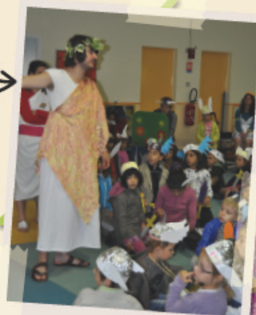
Jamais en manque d'idées, les animateurs de l' accueil de loisirs ont organisé une semaine sur les 12 travaux d'Astérix. Après avoir créé leurs épées, casques, médailles, les enfants sont entrés dans l'arène. Au programme, un parcours semé d'embûches et 12 travaux à réaliser tels que soutenir le regard d'Isis, lancer les flèches sur Jules César, finir toutes ses assiettes au repas, ou encore partir à la quête du trône...